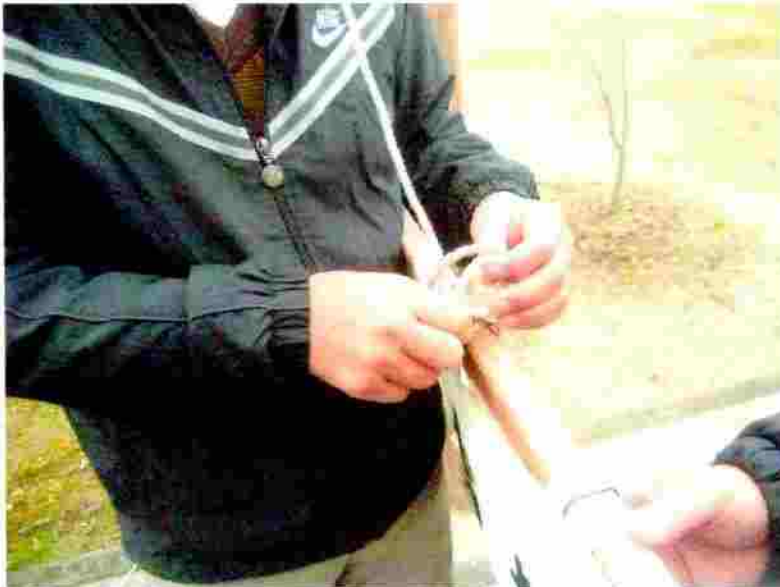
小松神社 のぼり竿の取付