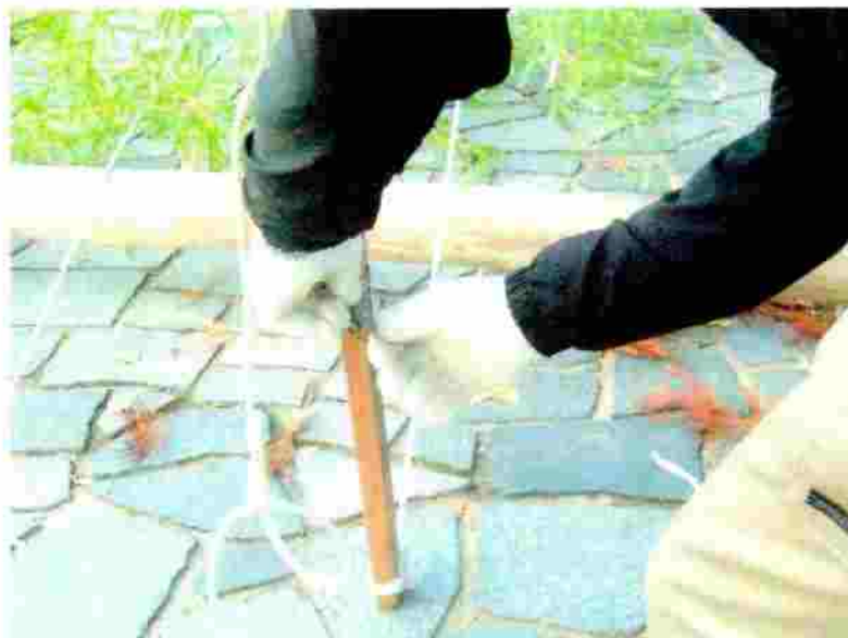
小町神社 のぼり竿の取付