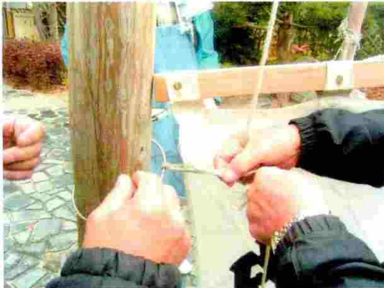
小松神社 のぼり竿の取付