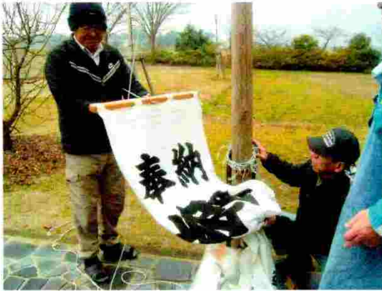
小松神社 のぼり竿の取付