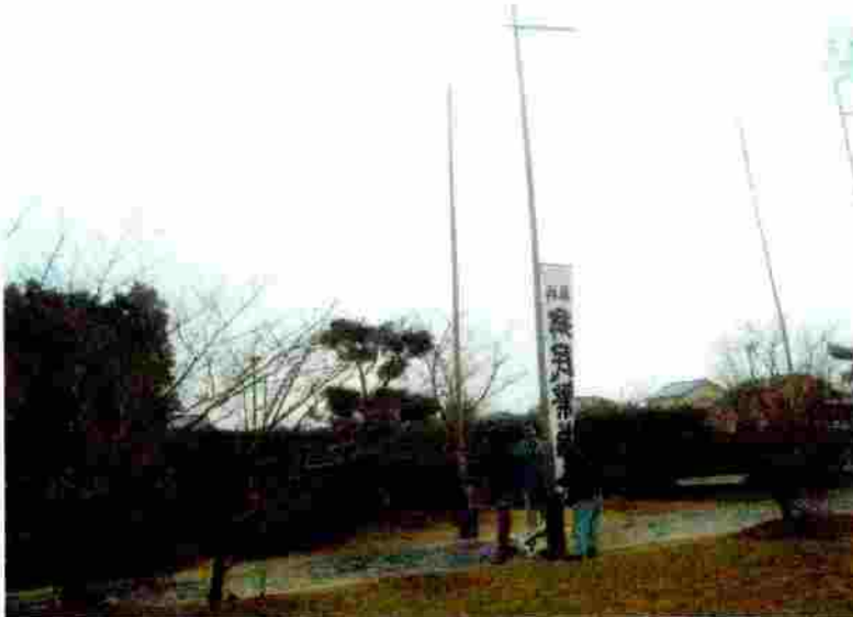
小松神社 のぼり竿の取付

上段のリングには ロープをリング内に 通すこと。 (上部の笹竹の竹筒に 引っかからないで リングが頂部まで 上がりやすい)