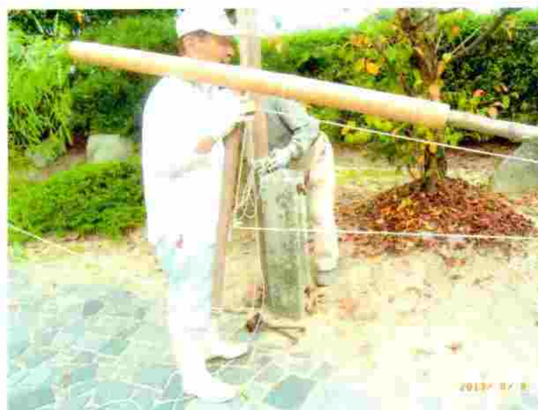
小松神社 のぼり竿の取付