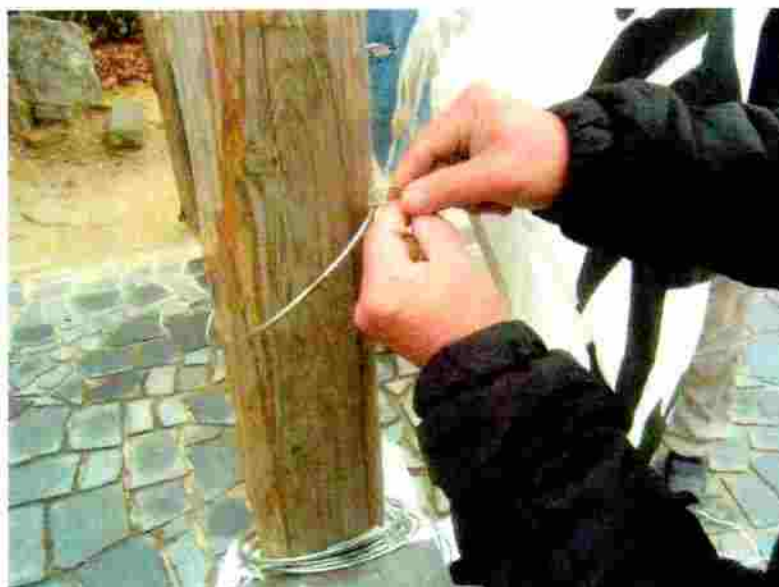
小松神社 のぼり竿の取付