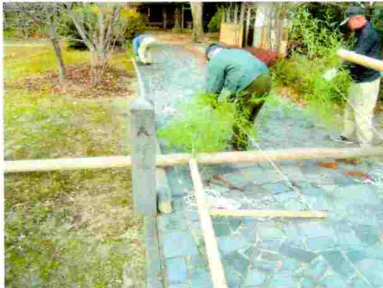
小松神社 のぼり竿の取付