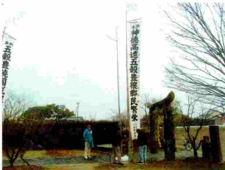
小松神社 のぼり竿の取付