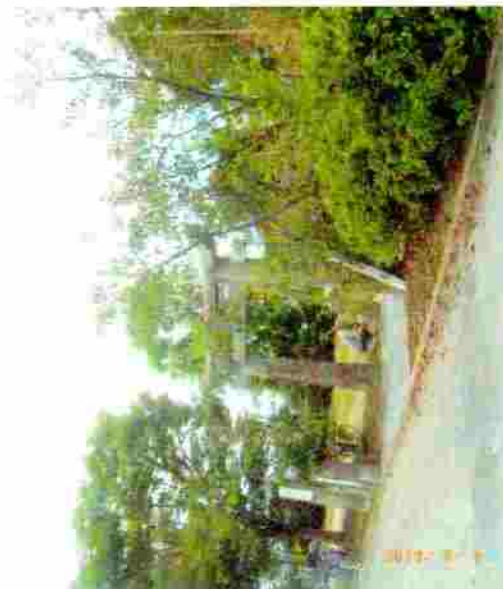
小松神社 のぼり竿の取付