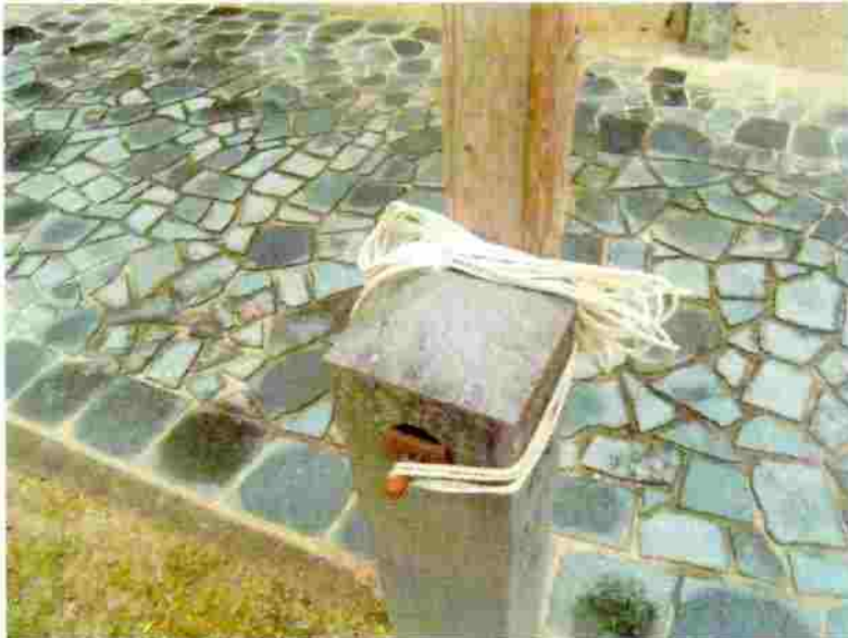
小松神社 のぼり竿の取付