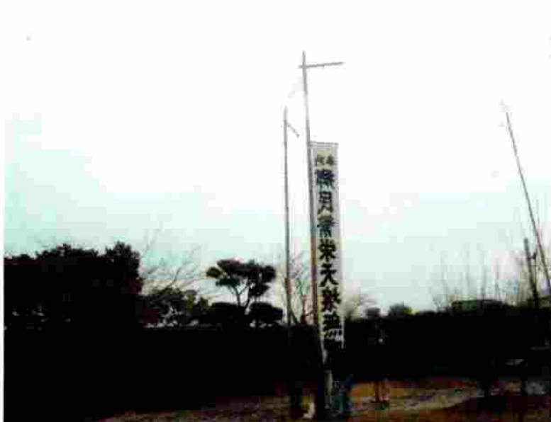
小松神社 のぼり竿の取付