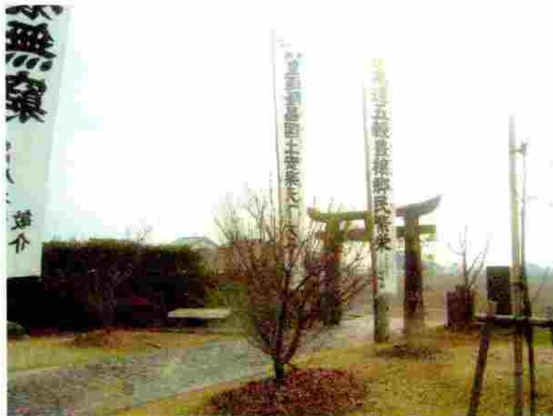
小松神社 のぼり竿の取付