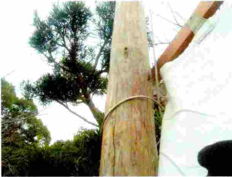
小松神社 のぼり竿の取付