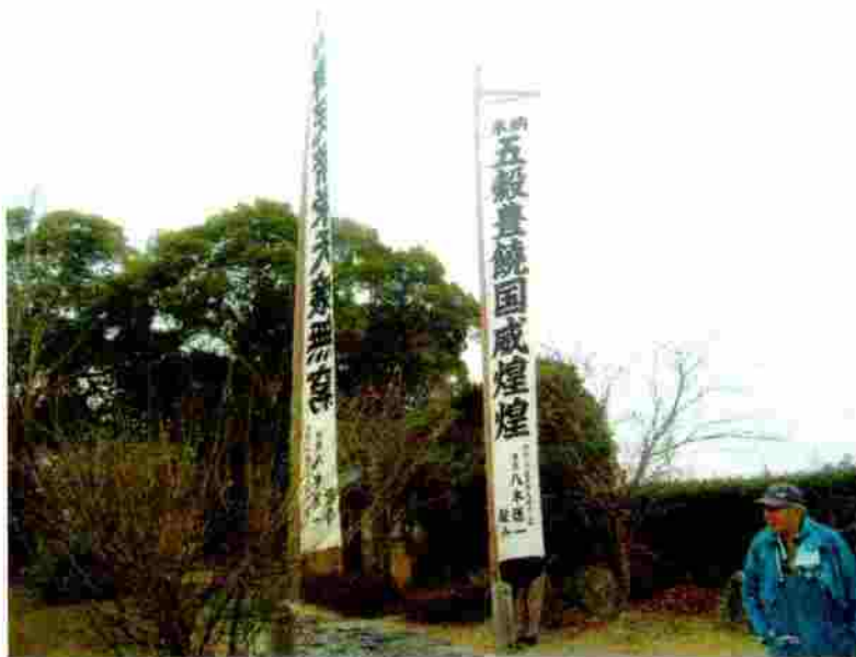
小松神社 のぼり竿の取付