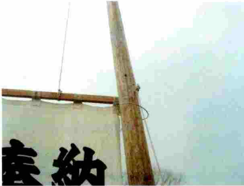
小松神社 のぼり竿の取付