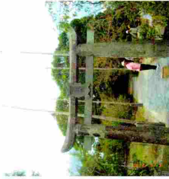
小松神社 のぼり竿の取付