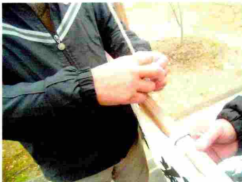
小松神社 のぼり竿の取付