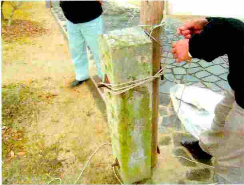
小松神社 のぼり竿の取付