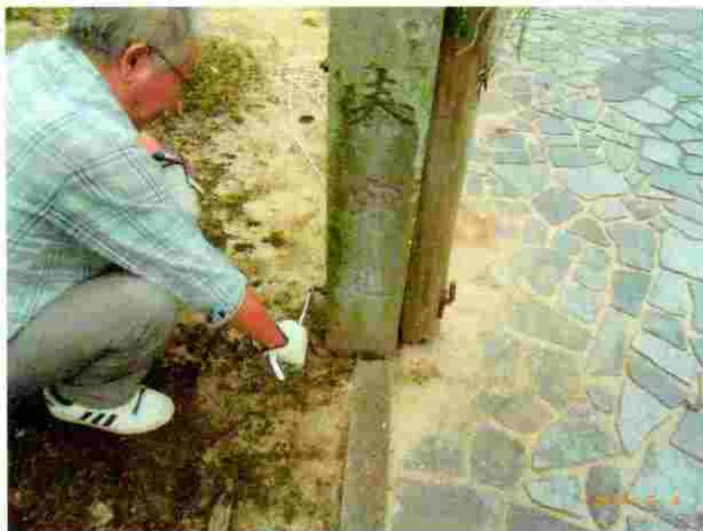
小松神社 のぼり竿の取付