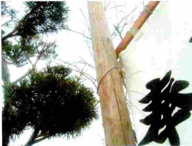
小松神社 のぼり竿の取付

上段のリングには ロープをリング内に 通すこと。 (上部の笹竹の竹筒に 引っかからないで リングが頂部まで 上がりやすい)